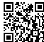
申込フォームQRコード